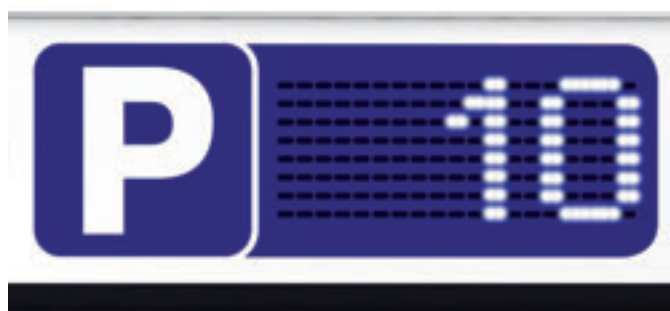
Funzionamento 2 LED per PIXEL 2 LED per PIXEL working