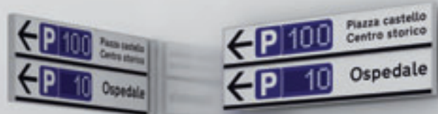
Applicazione a bandiera. Flag connection.